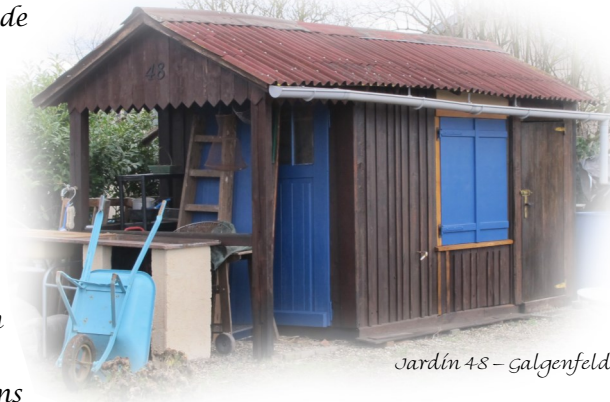
Jardin 48 - Galgenfeld

Que l'année 2021 vous apporte petits et grands bonheurs, santé, plaisir à jardiner !